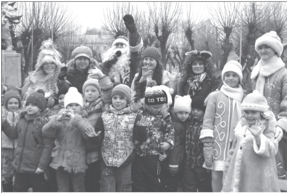
Ёлка открыта. Ура!

Открытие городской елки состоялось! Лесная красавица была установлена на площади и наряжена заблаговременно, но встречу приволжской ребятни с Дедушкой Морозом перенесли из-за сильного ветра. А когда он утих, дошколята дружно явились «за своими подарками». Ну, и повеселиться, конечно.