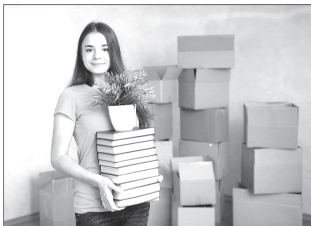
Этой девушке повезло - она дождалась своего жилья!

Напомним, что для решения проблемы с жильем для детей-сирот партия «Единая Россия» и Правительство РФ рассматривают возможность введения социальной выплаты на покупку жилья. Изначально о такой возможности председатель партии Дмитрий Медведев сказал в ходе проведения приема в общественной приемной «Единой России», затем эта инициатива обсуждалась на совещании Правительства 17 декабря. Эта инициатива касается лиц старше 23 лет, тех, кто имеет семью, воспитывает детей. Есть ситуации, когда двое сирот поженились, родились дети, они оба имеют по однокомнатной квартире в разных районах, не могут ими никак распорядиться, платят за эти квартиры и снимают трёхкомнатную квартиру.