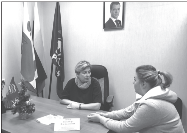
Перечень семей, которые могут рассчитывать на пособие, расширяется