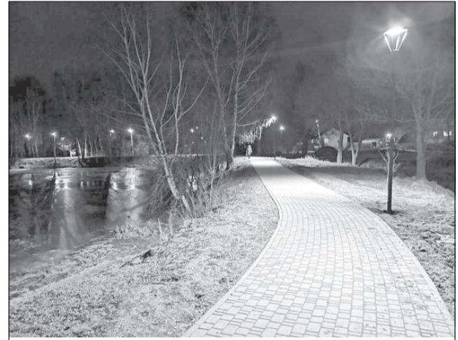
Проект благоустройства Верхнего пруда близок к завершению, к 22 декабря работы выполнены на 97%

Пусть Новый 2020 год будет плодотворным, благополучным и счастливым для всех!