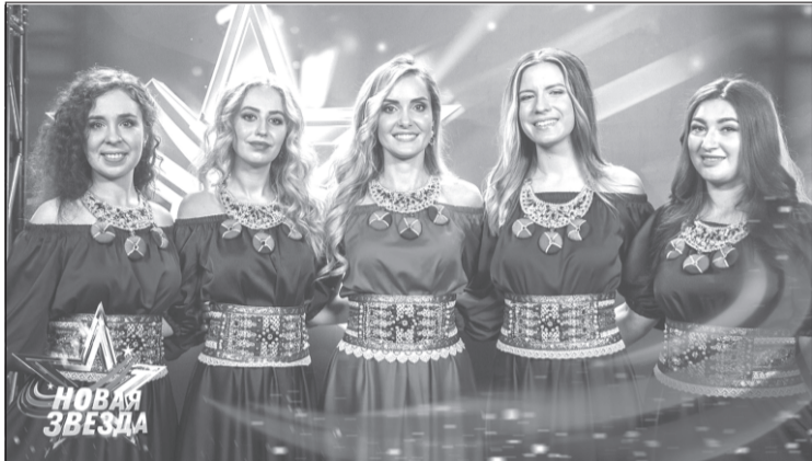
Ивановские участники телепроекта - группа «Русален»

Современные люди делятся на две большие группы: те, кто смотрит телевизор, и те, кто «живет» в Интернете. Наша новость адресована и тем и другим, потому что речь в небольшой статье пойдет о телепроекте «Новая Звезда», существующем уже несколько лет на телеканале «Звезда» и параллельно в Интернете: в соцсетях и на Ютубе.