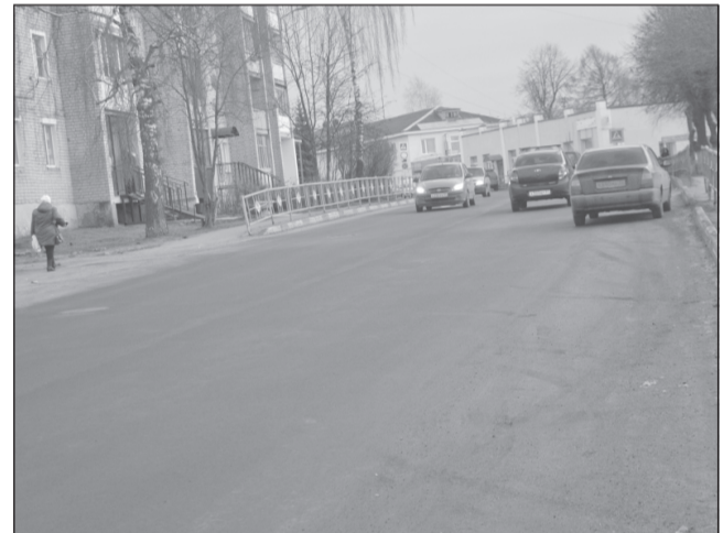
Так ровно и гладко выглядит трасса на ул. Революционной после капремонта