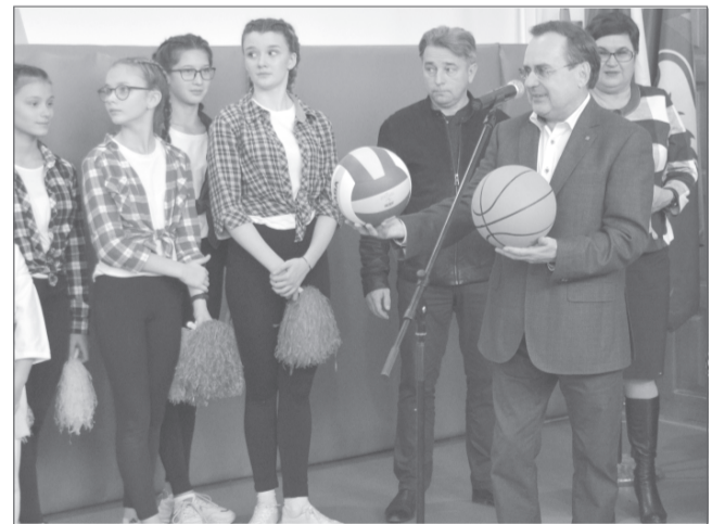
Торжественное открытие спортзала в школе №12