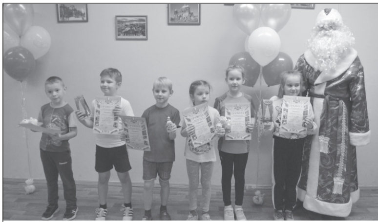
В Новый год - с победой

На базе Дома отдыха г. Плес в рамках акции «Полицейский Дед Мороз» сотрудники Госавтоинспекции по Приволжскому району провели торжественное мероприятие, посвященное встрече Нового 2020 года. Сотрудники перевоплотились из строгих полицейских в главных новогодних персонажей Деда Мороза и Снегурочку, без которых не проходит ни один праздник.