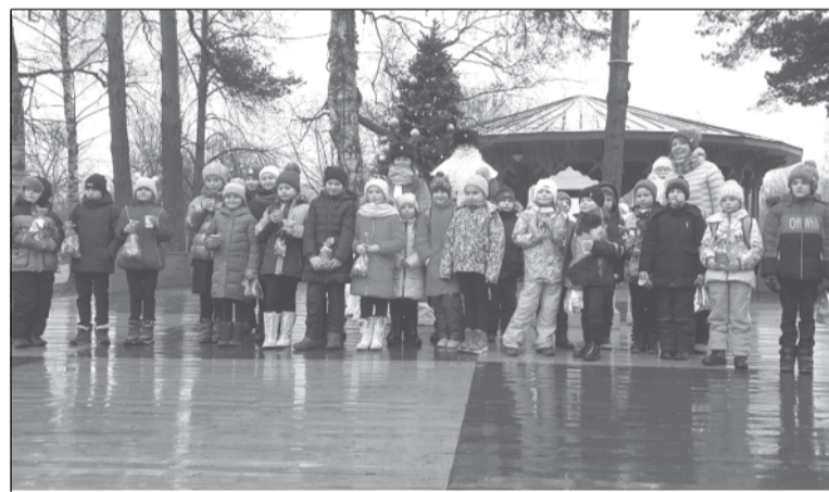
Жаль, что погода не новогодняя...

Снегурочка задавала каверзные вопросы, связанные с правилами перехода проезжей части, знанием дорожных знаков, сигналов светофора и применением световозвращающих элементов. Ребята дружно отвечали и отгадывали загадки, проявив при этом сообразительность и смекалку. Снегурочка объяснила юным участникам дорожного движения, что водители руководствуются не только сигналами светофора и дорожными знаками, но и в их отсутствие — жестам регулировщика. Она продемонстрировала жесты регулировщика, после чего ребята дружно под музыку повторяли их. В завершении мероприятия полицейский Дед Мороз поздравил с наступающим праздником юных участников дорожного движения и вручил новогодние подарки и световозвращающие брелоки.