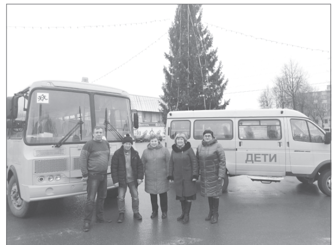
Новые автобус и газель для школьников