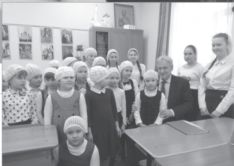
Воспитанницы в ожидании подарков

Накануне новогодних и рождественских праздников депутат Госдумы Юрий Смирнов посетил гимназию для девочек при Никольском женском монастыре в Приволжске.